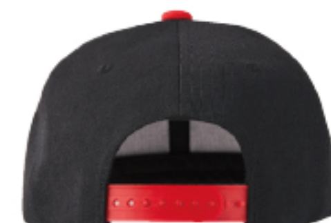
アメリカンバンド付き