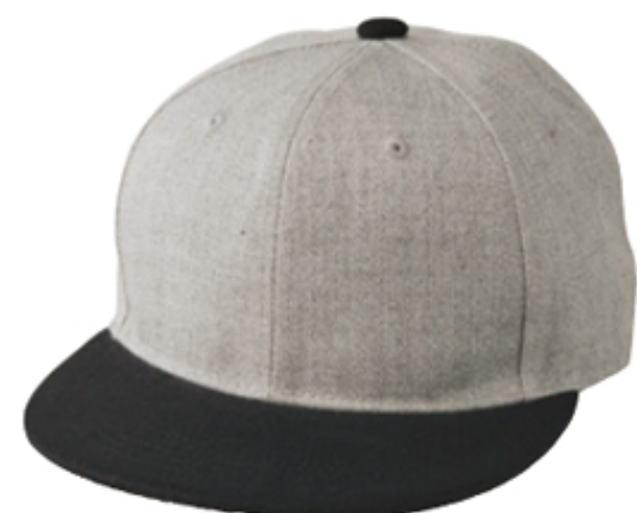
8802 ヘザーグレー/ ブラック