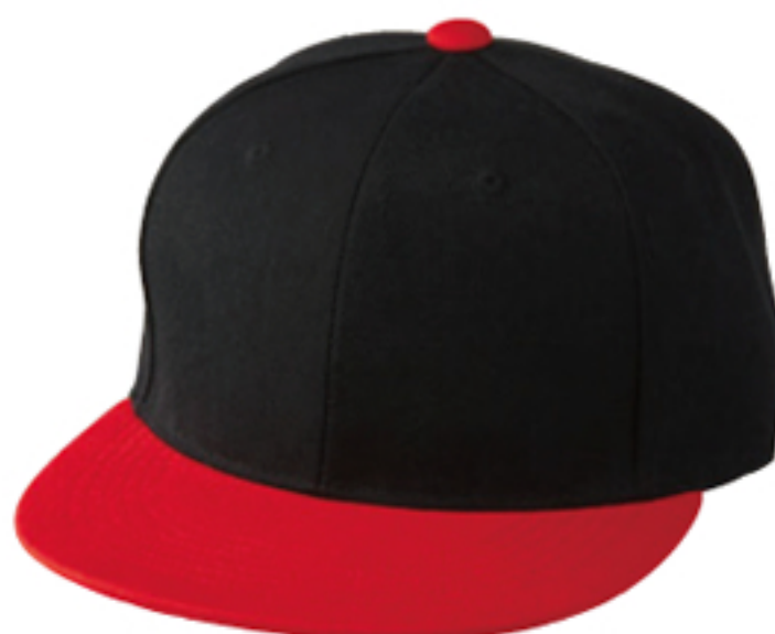
2050 ブラック/ レッド