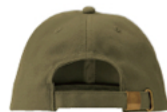
金属クリップアジャスター付き