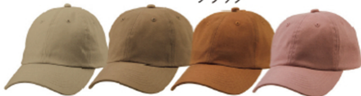
053 ライト ページュ