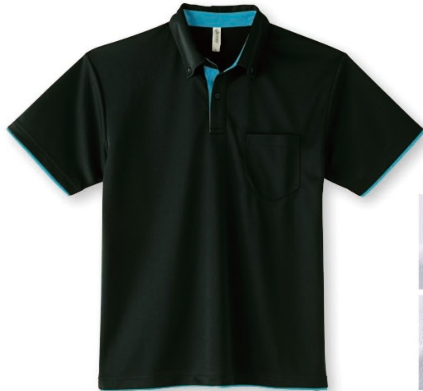
650 ブラック×ターコイズ