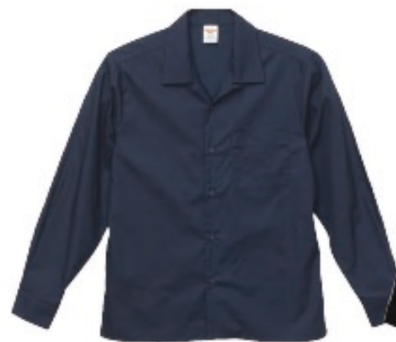
717 ダーク ネイビー